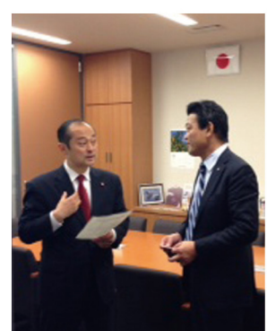
▲11月19日 中部電力立地部門から説明を受ける