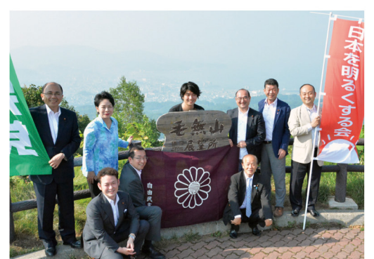
▲7月30日 日本を明るくする会街宣活動@北海道