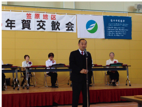
▲1月11日 笠原地区新年会