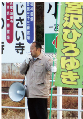
▲1月23日 大当所街頭演説