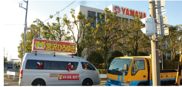
▲12月8日 遊説@ヤマハ発動機前