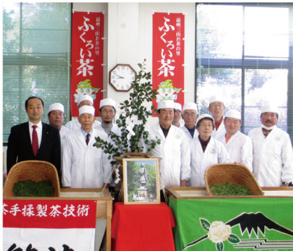
▲1月7日 袋井市茶手揉保存会初揉み