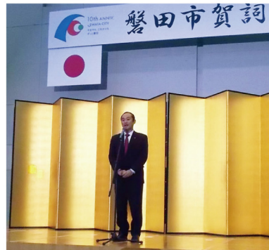
▲1月15日 磐田市賀詞交歓会