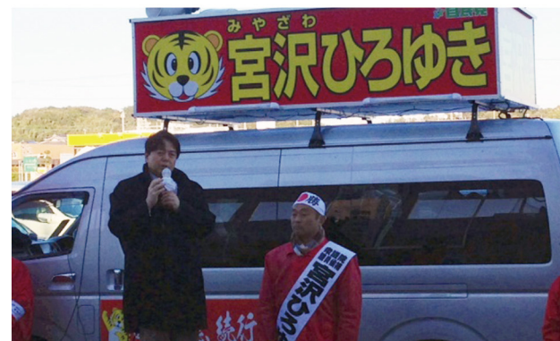
▲12月7日 農林水産大臣林芳正参議院議員 @イオン袋井店,@マックスバリュ-磐田店