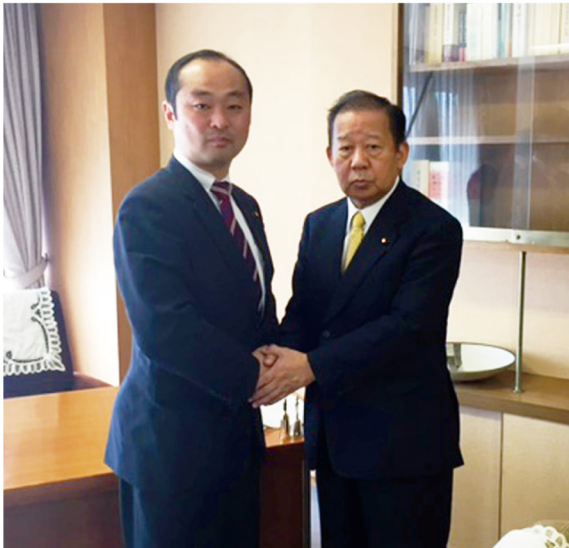
▲2月4日 二階俊博自民党総務会長に国土強靱化計画についてお話を伺いました