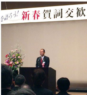
▲1月28日 菊川市商工会賀詞交歓会