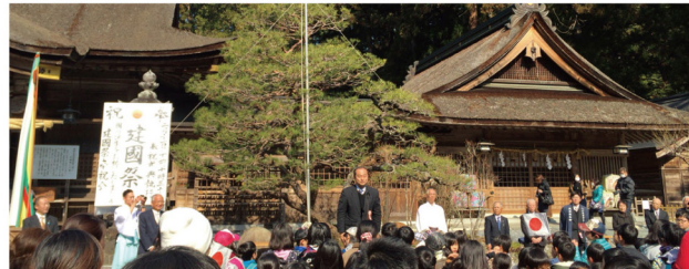
▲2月11日 小国神社紀元祭並建国記念式典