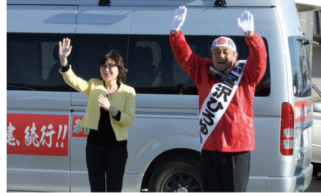
▲12月8日 自民党政調会長稲田朋美先生@JA 遠州中央豊田支店