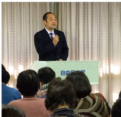
▲1月27日 自民党静岡県連 女性部中央研修会