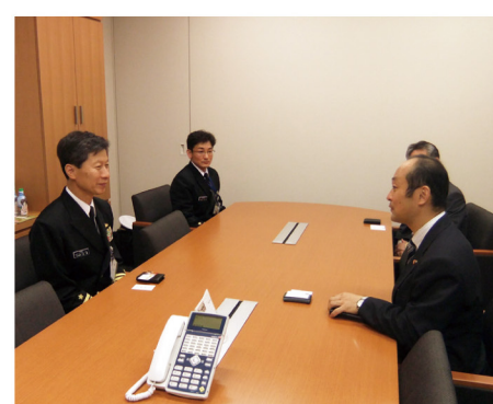
▲10月21日 新海上幕僚長が着任のご挨拶にご来訪下さいました