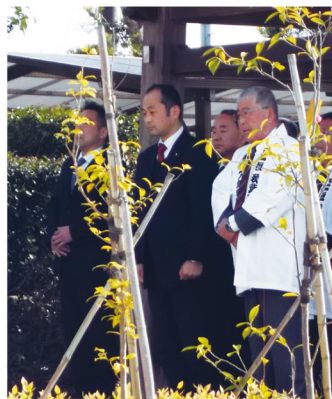
▲1月23日 秋葉神社通拝所神事