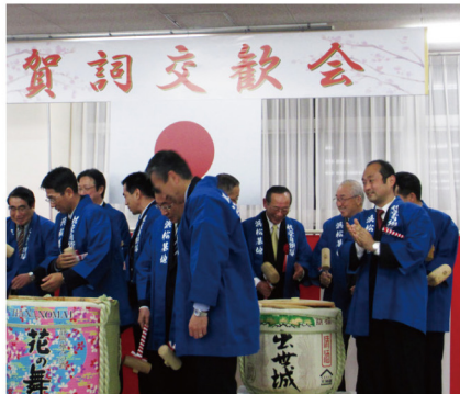
▲1月8日 浜松基地賀詞交換会