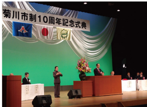
▲1月17日 菊川市制10周年記念式典