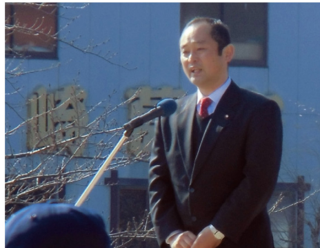
▲1月4日 掛川市出初式