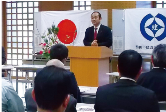
▲1月7日 磐田市建設事業協同組合新年会