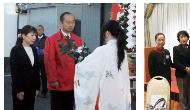
▲12月2日 神事@磐田事務所