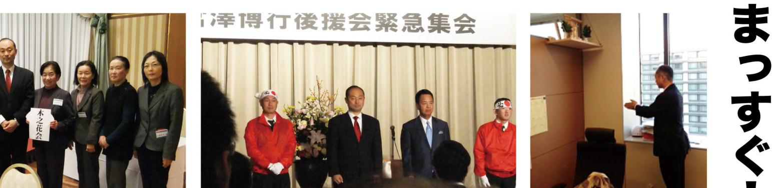
▲11月24日 甘利明大臣が応援に駆けつけて下さいました 宮澤博行後援会緊急集会