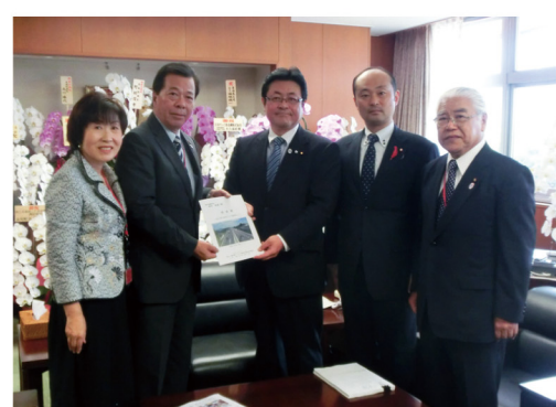
▲10月2日 国土交通省 西村明宏副大臣に島磐バイパス期成同盟会の要望