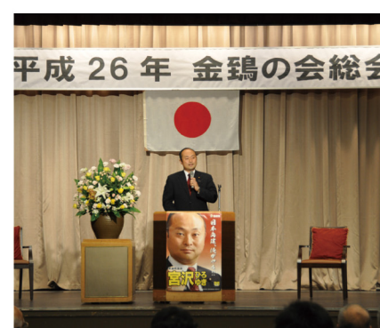
▲8月25日 平成26年「金鶏の会」総会