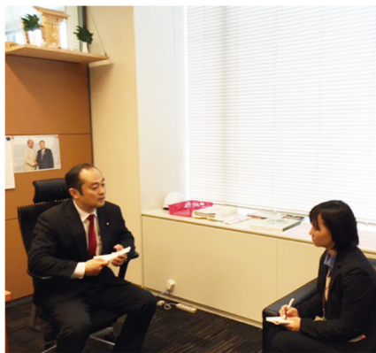
▲1月29日 静岡新聞取材