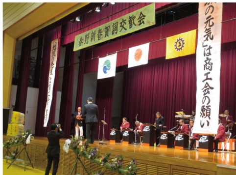
▲1月18日 第16回はるの新春賀詞交歓会