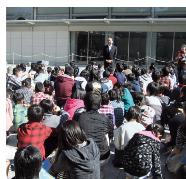
▲10月29日 磐田北小学校校会見学