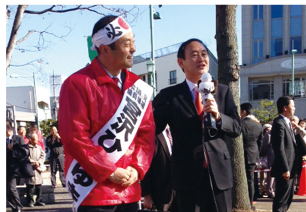
▲12月3日 菅義偉官房長官応援 @掛川駅前