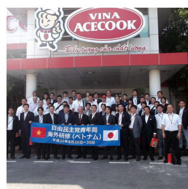
▲8月26~30日 自民党青年局海外研修@ベトナム