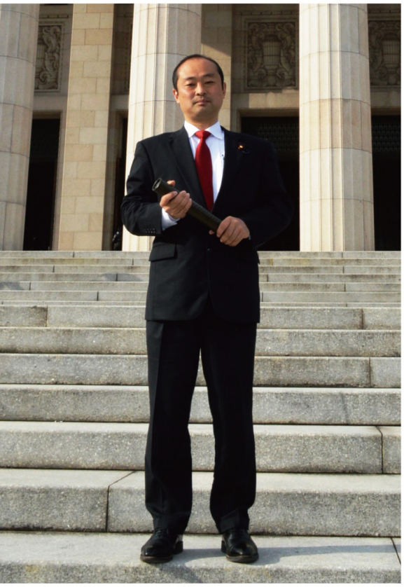
▲ 第47回総選挙を受けて初登院