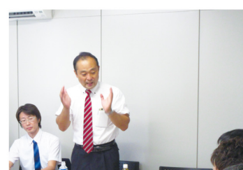
▲9月1日 静岡県理学療法士会の方々と座談会