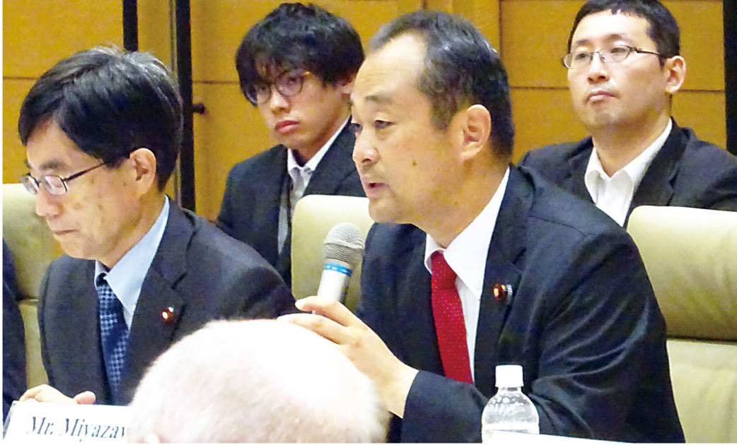
ノルウェー国会外務・防衛常任委員会との懇談会で活発な意見交換（8月31日）