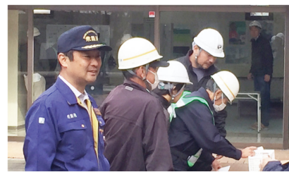
▲12月2日 磐田市地域防災訓練参加