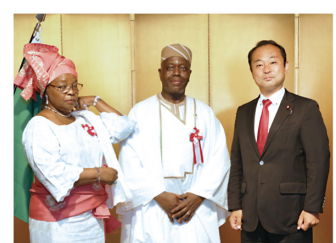
▲8月1日 ベナン国独立記念日レセプション