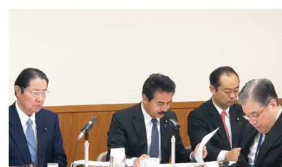
▲11月15日 国防議員連盟総会