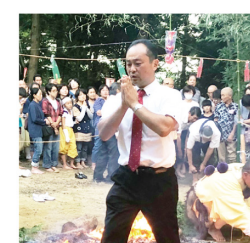
▲8月19日 遠州役行者尊祭典