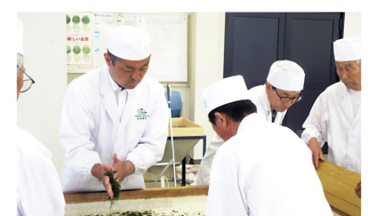
▲7月9日 袋井市茶手揉保存会 手揉製茶技術講習会