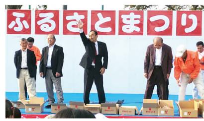
▲11月18日 ふるさとまつり 2018