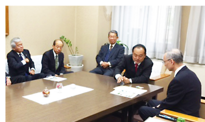
▲11月19日 中遠土地改良事業推進協議会 財務省主計局長へ要望活動