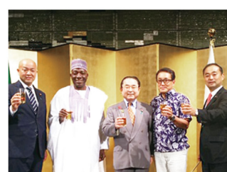
▲10月1日 ナイジェリア独立記念レセプション