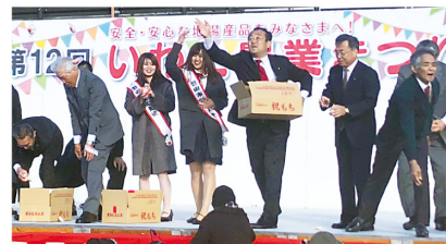
▲12月8日 いわた農業まつり