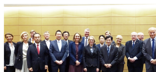
▲8月31日 ノルウェー国会 外務・防衛常任委員会との懇談会