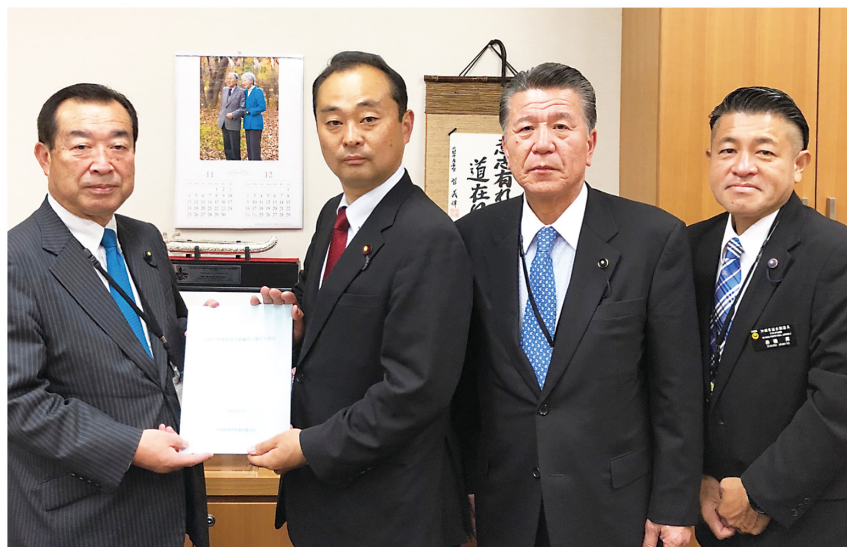
全国都道府県議会議員長団から要望を受けました。地方自治・地方創生に全力！（11月12日）

さて、毎年11月から12月にかけて、各部会では翌年度の税制・予算についての議論が激しく行われます。私の所属する総務部会で主なテーマとなったのは、経産省と総務省が対峙する自動車減税とその財源でした。私の立場としては、減税により地方財政に3500億円の穴が空くのは容認できないが、そうかと言って自動車減税をやらないければ、10月の消費増税の負の影響は計り知れないという非常に苦しい立場でした。一見すると対立する命題を解消するため