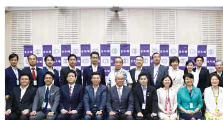
▲7月26日 順天堂大学 解剖学 ICU 見学