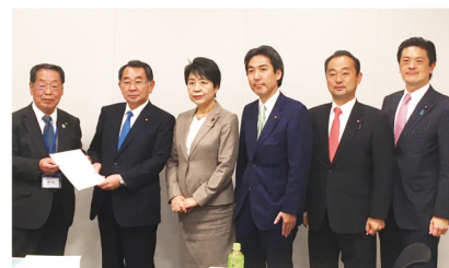
▲11月21日 JA 静岡中央会・県選出国會議員 税制改正意見交換会