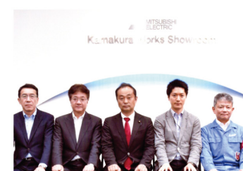
▲8月8日 三菱電機株式会社鎌倉製作所視察