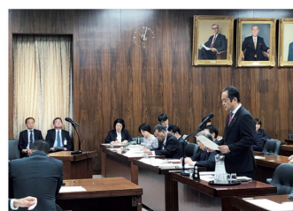
2019年11月13日 衆議院経済産業委員会質問