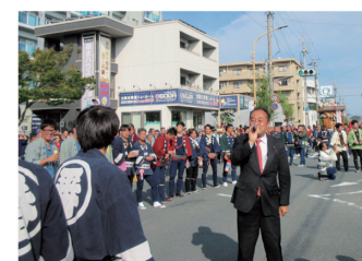
2019年10月27日 掛川十七町 天皇陛下御即位記念祝賀式典