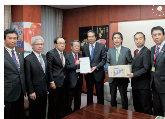
2019年11月20日 江藤拓農林水産大臣への 「降雹による農業被害に関する緊急支援要請」