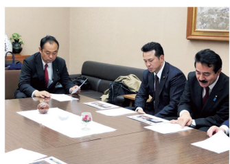
2019年12月10日 自民党国防議員連盟 財務省主計局長申し入れ