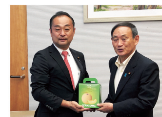
2019年9月6日 栄養俣官房長官に 地元メロンの贈呈@官邸