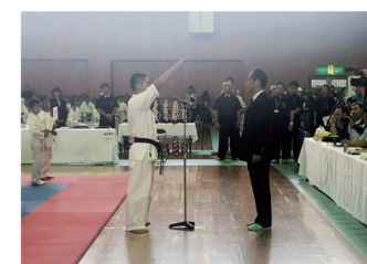
2019年9月22日 第5回オープントーナメント 静岡県空手道選手権大会