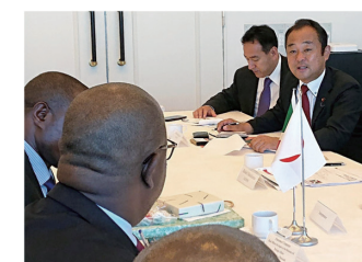
2019年8月29日 TICAD7 フルンジ共和国との会談