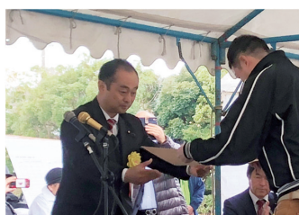
2019年12月7日 静岡県畜産共進会肉牛の部褒賞授与式