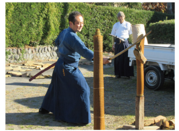
2020年1月5日 遠州抜刀会