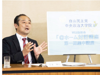
2020年6月29日 中央政治大学院 WEB 勉強会