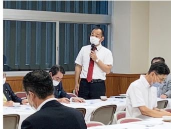
2020年7月14日 自民党「茶業振興議員連盟」