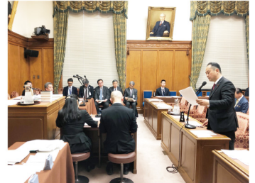
2020年2月25日 衆議院予算委員会第4分科会質問

中国海警局の公船は、今年に入り尖閣諸島の接続水域の航行や領海への侵入を繰り返すようになりました。中国の海警局は我が国の海上保安庁に相当しますが、近年は軍との一体化が進んでいることも指摘されています。我が国の領土に対する脅威はその性質を大きく変えたと言わざるを得ません。 私も事務局次長として参画している国防議員連盟では、国会の会期中と閉会中を問わず、勉強会を活発に続けています。領土問題と云うと、専ら外交と国防の議論に陥りがちですが、実は関わる省庁は外務省や防衛省だけではなくあります。中国軍の情報は防衛省、中国に対する抗議は外務省、尖閣諸島の概要は内閣官房、尖閣諸島の希少動物等は環境省、固定資産税評価は総務省が担当しています。 今この瞬間も東シナ海では海上保安庁が全面に出てきています。尖閣に関わる各省からのヒアリングと質疑を重ねており、これを議論としての提言にまとめたいと思います。 尖閣諸島は、沖縄本島から約410キロメートル、石垣島から約170キロメートル離れた絶海の孤島です。「島一つ中国にくれてしまえ」等といった乱暴な意見を時々目にしますが、領土を守るうとしない国家が、より大きな危機に直面した時に本当に国民の生命や財産を守るのでしょうか。私達の姿勢は日本国民からだけではなく、世界各国から「日本はどのように振る舞う国家なのか」と注視されていることをしっかりと肝に銘じて事に当たりたいと思います。