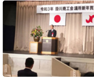
01/14 掛川商工会議所新年賀詞交換会