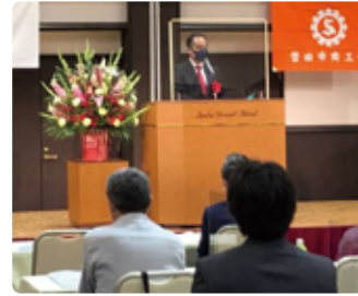
05/24 磐田市商工会通常総会