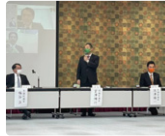
03/15 静岡農政対策委員会