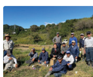
10/23 せんがまち棚田稲刈り