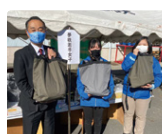
11/28 JA遠州夢咲農機商談会