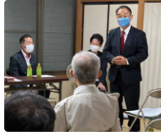
10/14 自民党袋井支部袋井分会