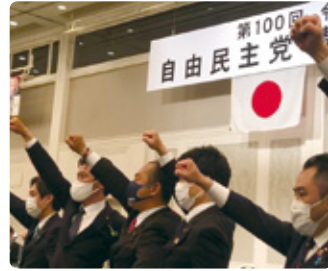
05/17 自民党静岡県連大会