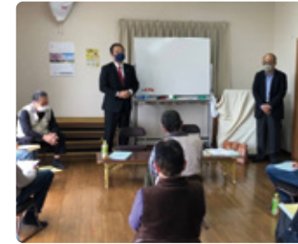
04/25 二之宮二丁目自治会総会