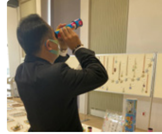
11/21 袋井西地区みんなの作品展