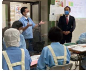
10/01 袋井市内企業朝礼挨拶