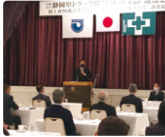
05/20 静岡県トラック協会中選支部通常総会