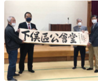
04/18 下俣区公会堂看板設置式典