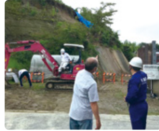
07/03 萱間地区土砂崩れ現場視察