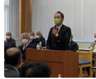
11/24 磐田用水東部土地改良区総代会