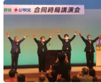
09/12 自民党・公明党合同時局講演会