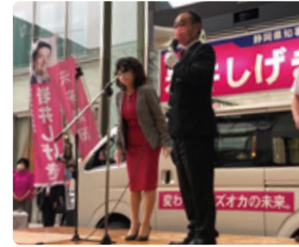
06/03 静岡県知事選挙(投票日:6/20)