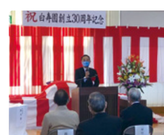
11/28 福祉施設記念式典